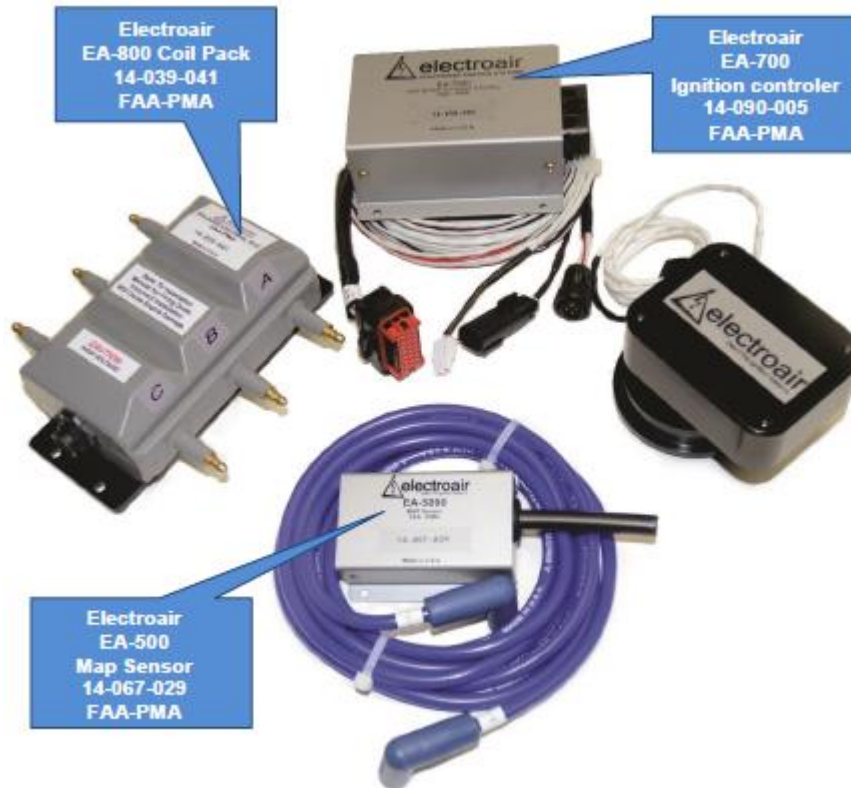
Marcas al AFCA (Figura 3)

Marcas al OTE (TSO Norteamérica y /JTSO – Europeo): Cada OTE debe ser marcado de acuerdo a la regulación RAC-21.21, sección 21.1315 (d):