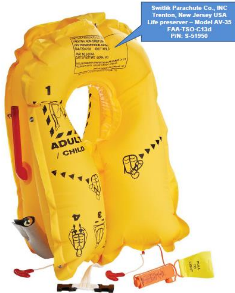
Marcas OTE (Figura 4)

Marca a partes estándar: Cada parte estándar debe ser marcada de acuerdo a las recomendaciones especificadas en cada estándar de fabricación. Ver las muestras (Figura 5), para visualizar algunos tipos de identificación aceptables.