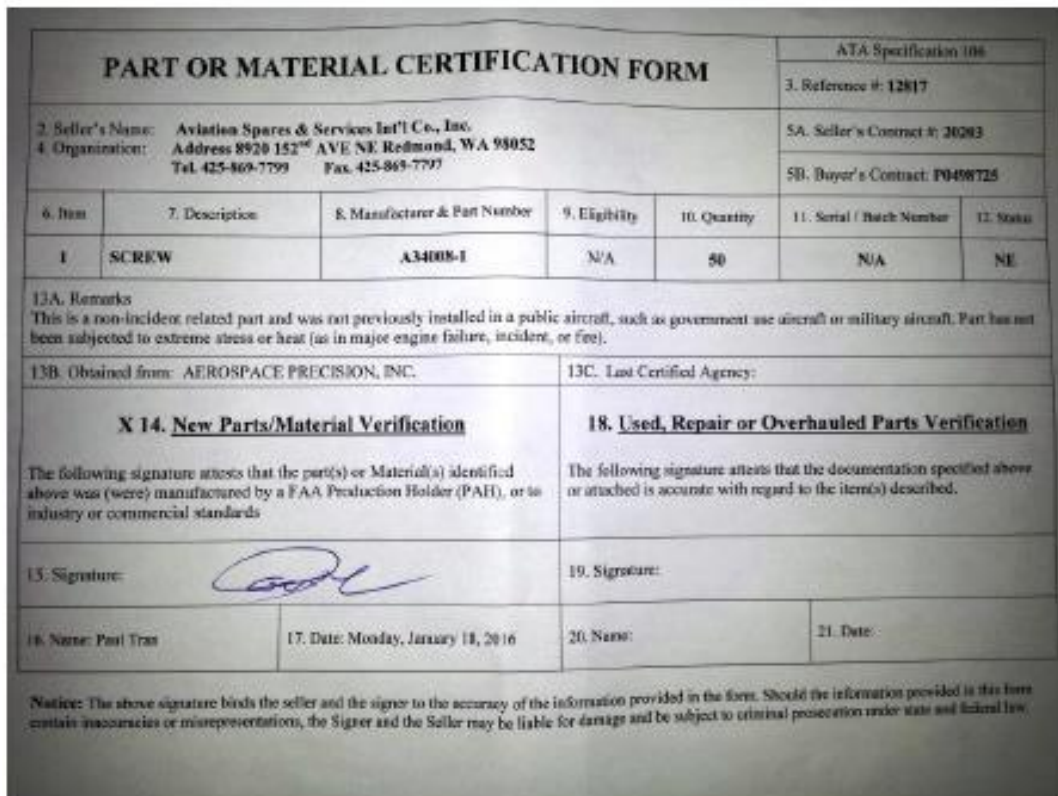
Formato de certificación ATA 106 (Figura 2)

4) Algunas veces, especialmente en el caso de componentes y partes baratas, la venta de dichos productos se realiza en condiciones “Como Está” (ver definición), esta condición no brinda ninguna garantía. Es responsabilidad de las personas encargadas de la adquisición de productos aeronáuticos en general (en representación del explotador), que éstos cumplan todos los requisitos y tengan su certificación y/o trazabilidad, según sea aplicable.